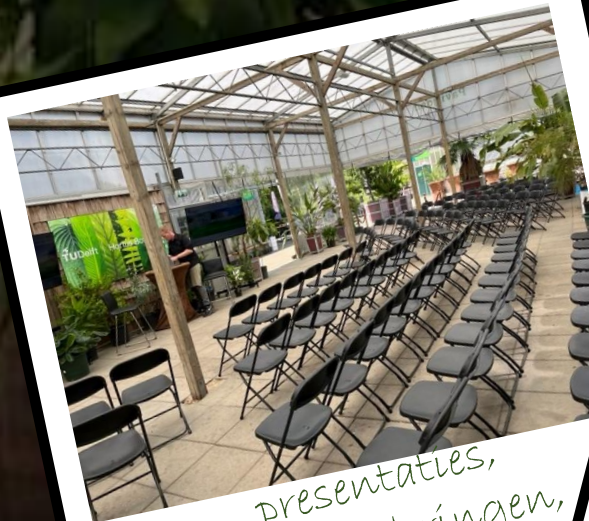
presentaties, vergaderingen, workshops