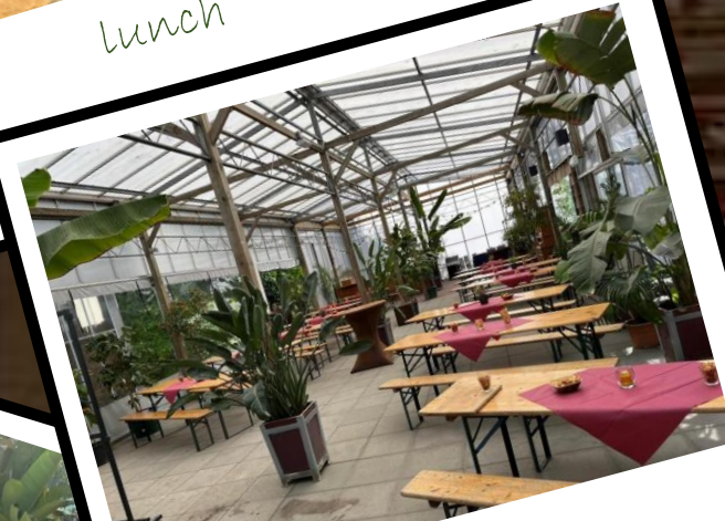
paviljoen: Diner tot ca. 140 P